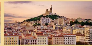
Meurtre au bistrot (2 salles de jeu)