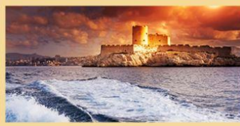
Couloir de la mort au château d'If (2 salles de jeu)