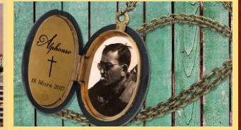
Le secret d'Alphonse (3 salles de jeu)

Escape Hunt a ouvert ses portes à Bordeaux, Paris, Nancy, Marseille, Clermont-Ferrand, la Rochelle, Nantes et Metz pour offrir aux nouveaux enquêteurs la possibilité d'élucider le mystère de leur ville... Escape Hunt devient ainsi le premier acteur du pays dans ce domaine d'activité avec 53 salles de jeux et 24 énigmes différentes dans 8 villes françaises.