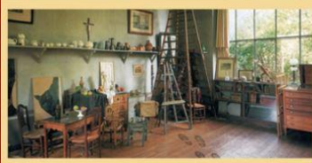
Vol à l'atelier de Cézanne (1 salle de jeu)